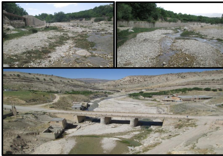
شکل ۲. نمونه‌هایی از عوارض انسانی موجود در بازه‌های مورد مطالعه

برای بررسی این مورد، پل‌ها و سازه‌های انسانی، بندهای انحرافی انتقال آب از رودخانه به اراضی کشاورزی، جاده‌های ارتباطی در مسیر سیلاب و عملیات کشاورزی و باغات ایجادشده در دشت‌های سیلابی اطراف رودخانه و در خیلی از موارد حتی در بستر رودخانه به دلیل سهولت دسترسی به منابع آبی از طریق بازدیدهای میدانی شناسایی شد تا تأثیر آن‌ها در تشدید سیلاب مشخص شود (شکل ۲). متغیر کمی در این بررسی درصد طول سازه‌های مصنوعی با بازه‌های مورد مطالعه بود ( A_s ) ۱ .